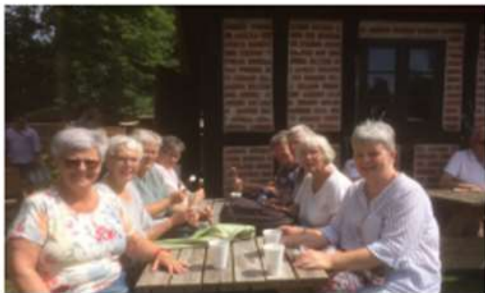
Glade deltager fra ALMUENS tur til Voergaards Slot.

Men der blev hygget, snakket og drukket kaffe i det dejlige solskin – så vi er klar til at gøre det om i 2018.